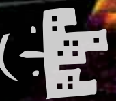
Illustrazione di Lorenzo Mattotti da "Le avventure di Pinocchio" Einaudi

Presidente Associazione Teatrale Pistoiese